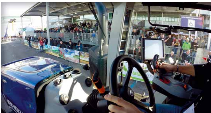
Motori caldi nell'Area esterna A davanti al padiglione 4 per il Dynamic Show con le macchine in movimento per i settori di pieno campo e viticoltura

za sono agricoltori e contoterzisti, anche se visiteranno la fiera i rappresentanti del mondo tecnico e della distribuzione delle macchine agricole e dei servizi, oltre naturalmente i tanti studenti.