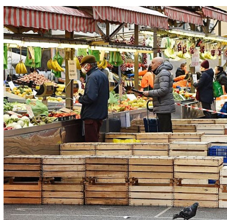
Anche i mercatini degli agricoltori possono rispettare le indicazioni per la sicurezza

A sollecitare con forza la loro riapertura vi sono anche l'Associazione rurale italiana e FederBio. Quest'ultima attraverso una nota del presidente, Maria Grazia Mammuccini, chiede «perché i mercati all'aria aperta, probabilmente meno esposti dei supermercati alla diffusione del virus, non possano avere in pochi giorni norme di sicurezza compatibili con