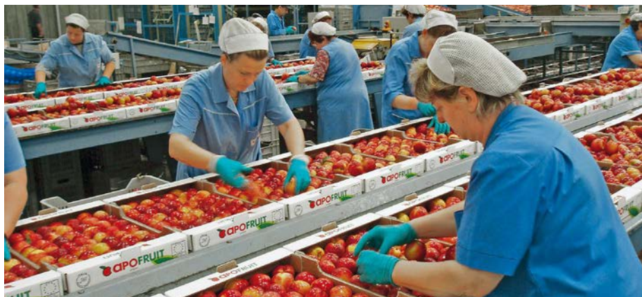
Le richieste del Copa-Cogeca sono state completamente ignorate dal commissario UE all'agricoltura Janusz Wojciechowski

le principali organizzazioni produttive dei Paesi mediterranei hanno accolto con comprensibile delusione le misure annunciate dal commissario UE all'agricoltura Janusz Wojciechowski che, per quanto riguarda il comparto ortofrutticolo, ha totalmente ignorato le richieste che la Copa-Cogeca, a nome di tutti i produttori e le cooperative europee, aveva fortemente sollecitato nelle scorse settimane.