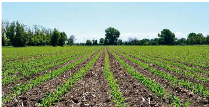
L'erogazione anticipata del 70% dei pagamenti diretti del 2020 dovrebbe avvenire in modo automatico, senza bisogno che il beneficiario presenti un'apposita richiesta

In sede di conversione del decreto Cura Italia in via di approvazione è prevista una modi-