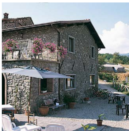
Gli ampi spazi degli agriturismi facilitano il distanziamento sociale imposto dall'emergenza Covid-19