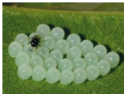
Una vespa samurai attacca uova di cimice asiatica.

A questo punto all'appello mancano altri due decreti la cui discussione e approvazione procederà in parallelo. In altre parole, mentre le Regioni richiederanno la deroga al Ministero dell'ambiente per poter immettere nell'ambiente la vespa samurai, il Ministero delle politiche agricole sottoporrà alla Conferenza Stato-Regioni il Programma di azione.