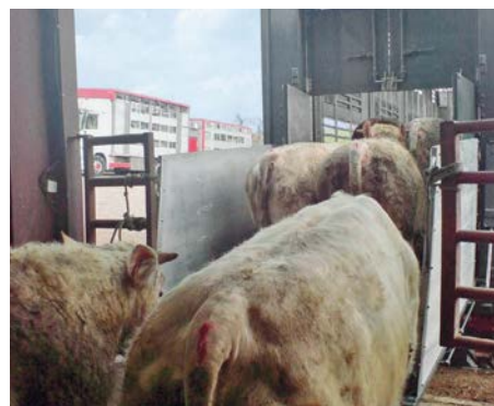
Nelle prossime settimane appare più incerto il rifornimento dalla Francia di torelli da ingrasso

La fase positiva della produzione di vitelloni continuerà almeno per i prossimi 6 mesi, le stalle sono infat-