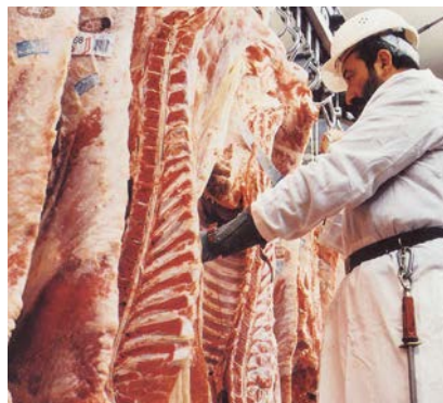
L'ammasso per le carni riguarderà i settori bovino, ovino e caprino

Il nuovo pacchetto di aiuti prevede inoltre una deroga eccezionale alle regole di concorrenza dell'UE per i settori del latte, dei fiori e delle patate, con gli operatori che potranno adottare misure di auto-organizzazione per far fronte alla crisi. Per esempio, il settore del latte sarà autorizzato a pianificare collettivamente la produzione di latte e il settore dei fiori e delle patate sarà autorizzato a ritirare i prodotti dal mercato. Sarà inoltre consentito lo stoccaggio da parte di operatori privati.