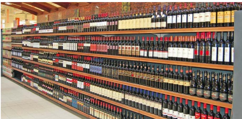
Differenze nel livello di sostegno ai produttori di ogni singolo Stato membro inevitabilmente creeranno distorsioni nella concorrenza sul mercato europeo

Ed è chiaro che l'entità della prossima vendemmia è un elemento im-