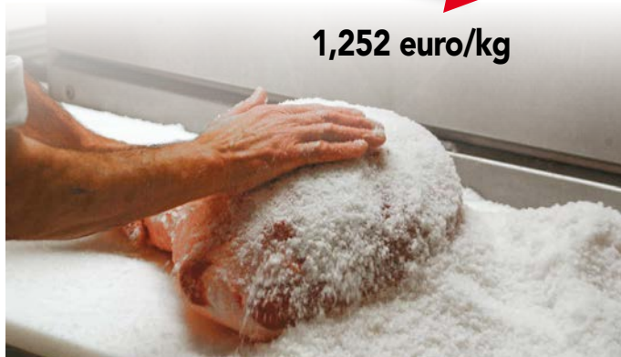
Sensibile il calo, rispetto all'anno scorso, del prezzo dei suini grassi destinati alla produzione dei prosciutti dop

Le quotazioni dei suinetti di 30 kg nel 2020 sono arrivate a 96,60 euro/capo, contro 87,80 dello scorso anno. La coscia per crudo dop è ferma a 3,41 euro/kg, la spalla a 3,46, il lombo a 3,20.